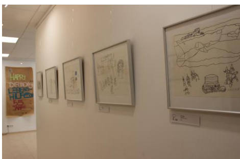
Bild 4: Anlässlich des 55-jährigen Jubiläums der Lebenshilfe OÖ haben die drei Kunstteliere gemeinsam ein Kunstprojekt umgesetzt und daraus eine Ausstellung in der Galerie Kreativum in der Lebenshilfe-Werkstätte in der Linzer Kapuzinerstraße konzipiert.

Bildhinweis: Lebenshilfe OÖ (Abdruck bei Nennung honorarfrei)