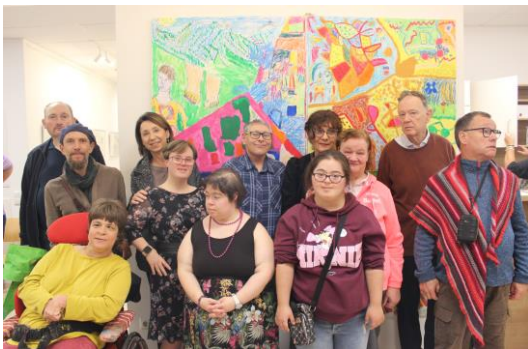
Bild 1: Gruppenfoto der an der Ausstellung „Gemischtes Konfekt“ der Lebenshilfe OÖ beteiligten Künstler*innen mit zuständigen Mitarbeiter*innen

Öffnungszeiten: MO, MI, DO: 9.00-15.30 Uhr und FR: 9.00-12.30 Uhr sowie nach Vereinbarung (Tel.: 0732 922024-14, E-Mail: kreativum@ooe.lebenshilfe.org)